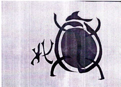
Зразок композиції за темою «Слово-образ»